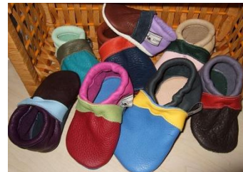
„Kiste Kunterbunt“ zum Durchprobieren in verschiedenen Größen gegen Kaution